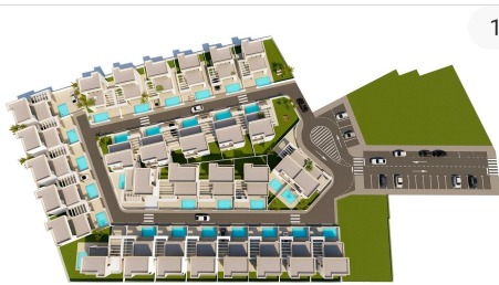
parcela residencial orihuela costa